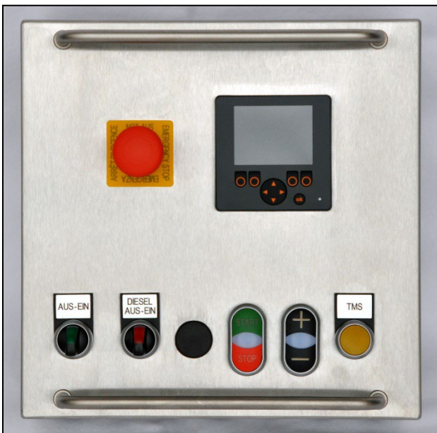
Option: kabelgebundene Totmannschaltung